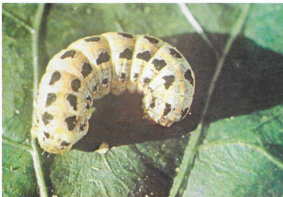
Larve de Spodoptora Littoralis .